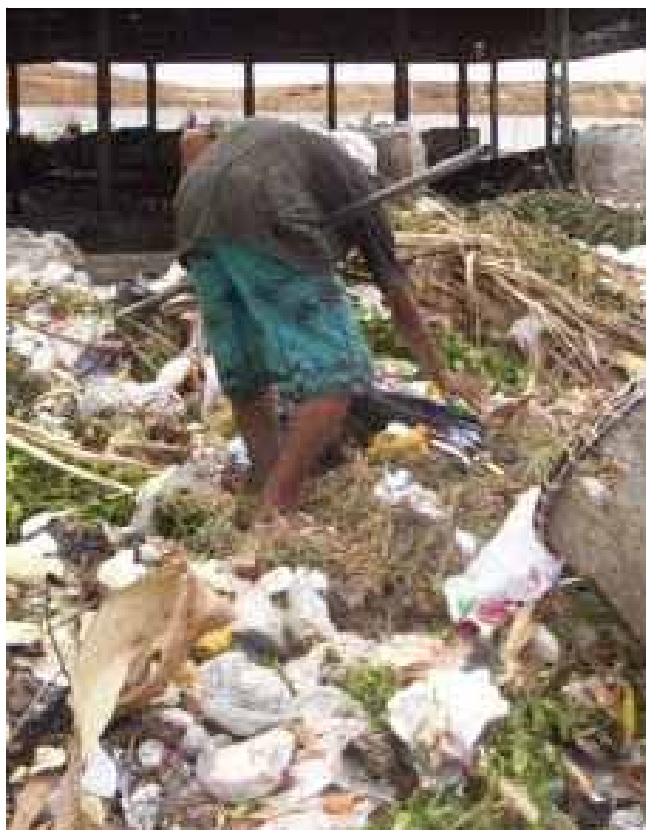
Catadores trabalham desprotegidos em meio a todo tipo de lixo

Durante a inspeção, o procurador tomou depoimentos e ouviu as reclamações dos trabalhadores. Eles não recebem da cooperativa a que estão ligados quaisquer materiais. Somente os que têm condições próprias ingressam na usina com bota ou luva. Muitos usam as próprias camisas como máscaras.